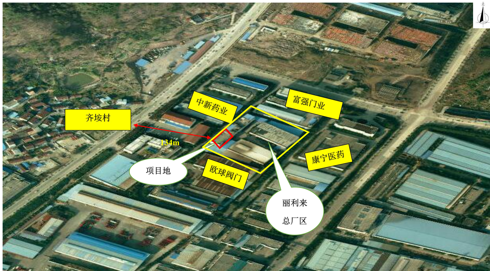
图 2-1 项目地理位置