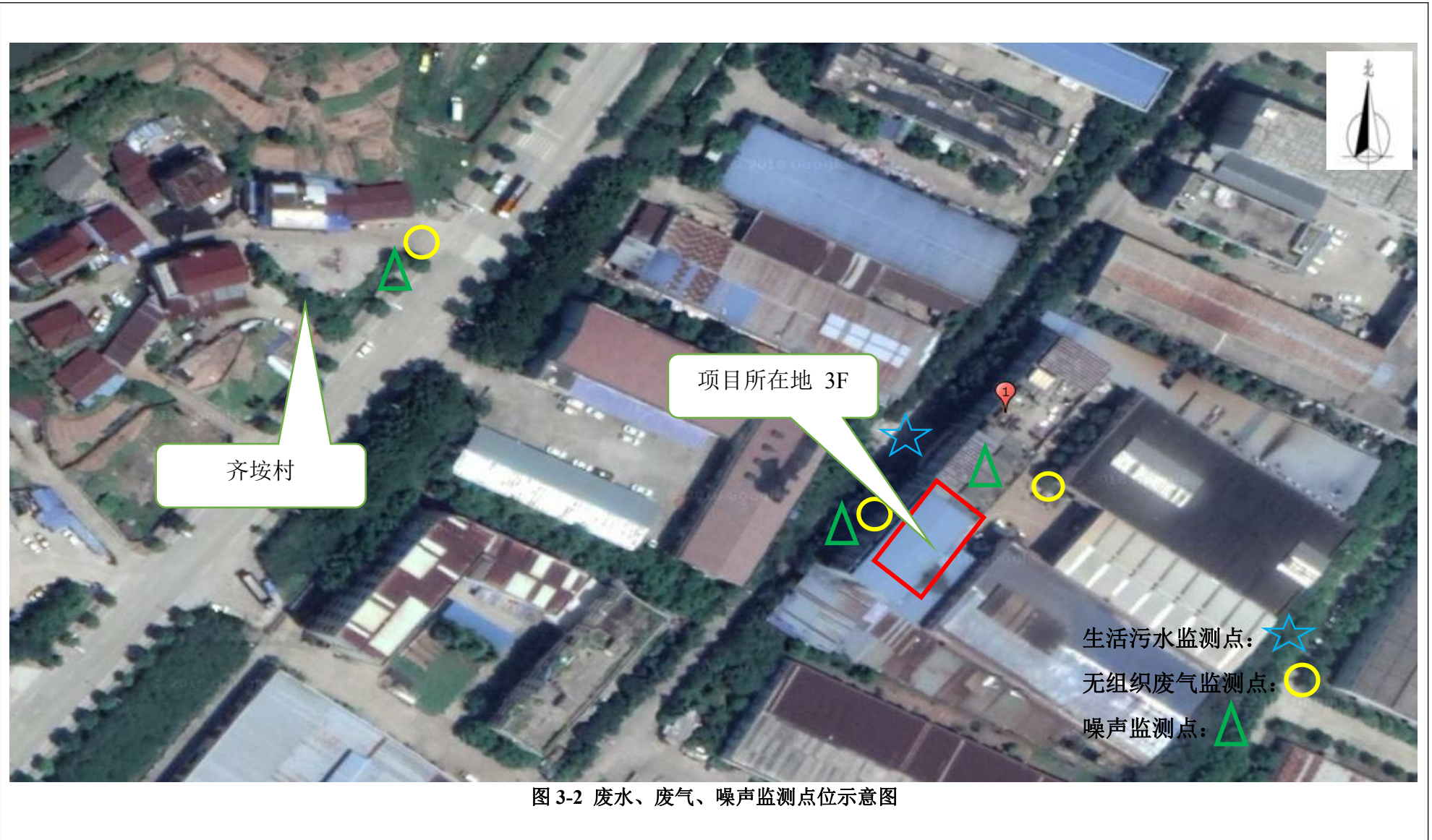
图 3-2 废水、废气、噪声监测点位示意图